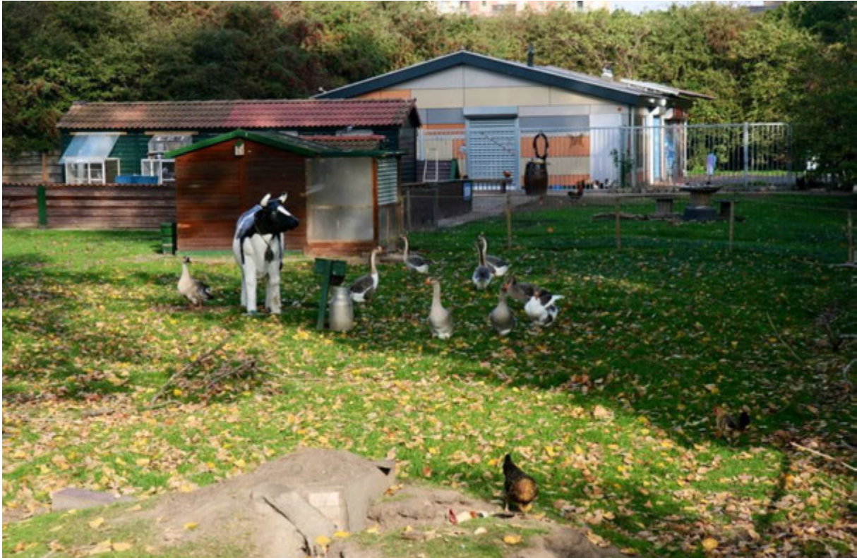
Aanzicht van de dierenweide met op de achtergrond Knop-Op